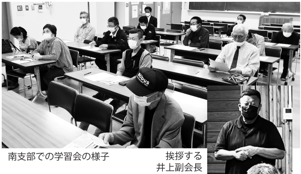
南支部での学習会の様子